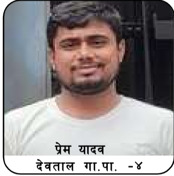
प्रेम यादव देवताल गा.पा. -४

तोहारा भागे से, ऊ लोग जीयते मर गईलन । तु उनकर बेटी बाडु, ई सोच-सोच पछतईहन ॥