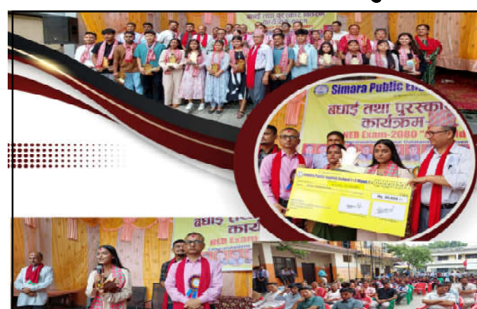
विद्यार्थीलाई सम्मान गर्दै विद्यालय।

उसले १४ जना विद्यार्थीहरुलाई जनही रु ३० हजारको दरले पुरष्कार वितरण गरेको छ। राष्ट्रिय परीक्षा बोर्डले सार्वजनिक गरेको कक्षा १२ को परीक्षाको नतिजामा अक्षरांकन (जि.पि.ए.) पद्धतिअनुसार ए प्लस ल्याउने विद्यार्थीहरुलाई सो बराबरको रकम प्रदान गरिएको एस.पि.ई.एस.ले जनाएको छ। उनीहरुको प्रोत्साहनका लागि विद्यालयले विहीवार बधाई तथा पुरष्कार वितरण कार्यक्रमको